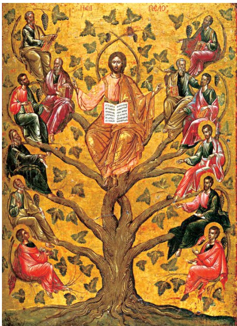
<참포도나무이신 예수 그리스도> 16세기, 비잔틴 미술관, 그리스